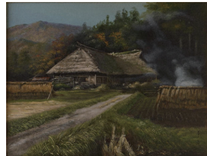
大久保景造《野焼きと》1994

画家として、抽象、具象、えんぶりの墨彩と多様な絵を描いたのみならず、詩人、ジャズ喫茶「車門」のマスター、カルチャー雑誌の編集長など、多彩なジャンルの文化人であった大久保景造を紹介します。