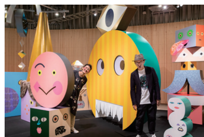
tupera tupera @tupera tupera