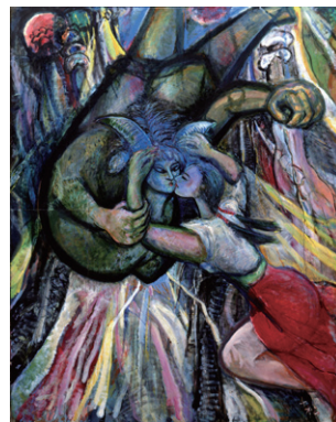
岩館千松《たなばた》1980