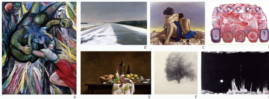
A. 岩館千松《たなばた》1980 B. 佐藤淳子《粉雪のウィスコンシン》1994 C. 明山應義《母子G》1998 D. 豊島弘尚《ロキとオーディン》1988 E. 下村正二《流れる時の記念碑》1993 F. 戸村茂樹《樹影VI》1990 G. 岩沢喜作《冬の海岸の枯木と鳥》1987