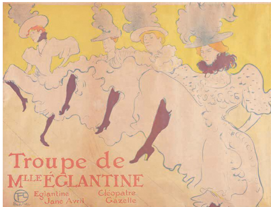
アンリ・ド・トゥールーズ＝ロートレック 『エグランティヌ嬢一座』1896