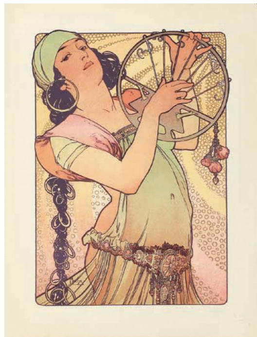
アルフォンス・ミュシャ 『エスタンプ・モデルヌ』より『サロメ』1897