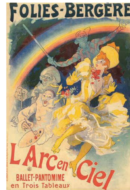
ジュール・シエレ 『「虹」フォーリー・ベルジェール』1893