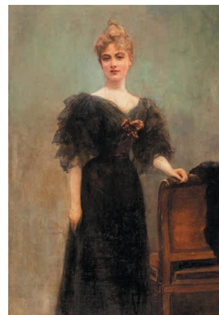
アンリ・ジェルベクス 『金曜日の宵』1900年頃