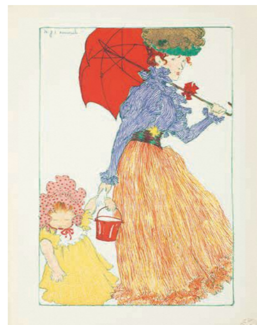
アンリ・エヴァンゴール 『エスタンプ・モデルヌ』より『広場にて』1897

19世紀末から20世紀初頭にかけて、パリが世界有数の大都市として大きく発展した時代「ベル・エポック（美しき時代、良き時代）」。 当時の享乐的な雰囲気象徴する芸術家のひとりであるアンリ・ド・トゥールーズ＝ロートレック(1864-1901)は、身体的なハンディがありながらも、鋭い観察眼や的確なデッサン力を持ち、他の作家は描こうとしない動きのあるものを正確に描くことができました。 本展では、36歳の若さで人生の幕を閉じたロートレックをはじめ、ドガやミュシャ、デュフィらの作品およそ320点の展示とともに、劇場や盛り場、女性のファッション、人々の生活など、華やかな時代の姿を映し出したパリの芸術を紹介します。また、八戸展の独自企画として、市民との「ジャポニズム〜ベル・エポック共創企画」も実施します。