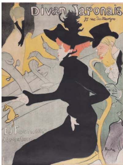
アンリ・ド・トゥールーズ＝ロートレック 《ディヴァン・ジャポネ》1893