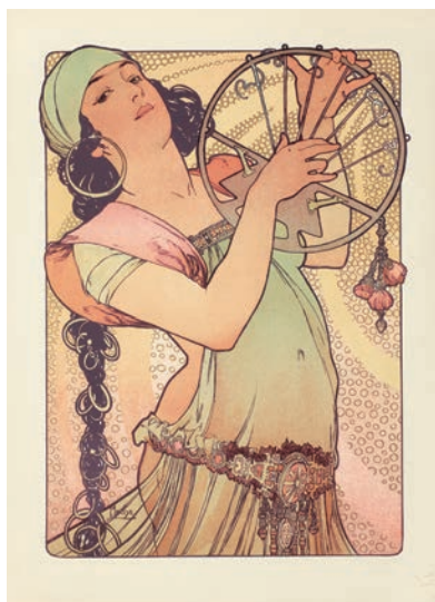
アルフォンス・ミュシャ 『エスタンプ・モデルヌ』より《サロメ》1897