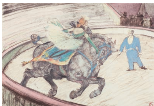
左 | アンリ・ド・トゥールーズ＝ロートレック 《エグランティーヌ嬢一座》1896