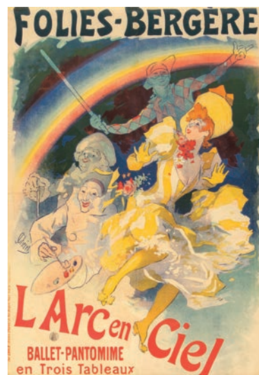
ジュール・シェレ 《「虹」フォーリー・ベルジェール》1893