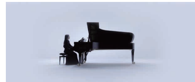
《A Live vol. 2 : Canto Ostinato》2020 ©Tomoko Mukaiyama + Reinier van Brummelen [参考図版]

対象 | 今回のワークショップ、11月上旬[稽古、複数回]、11月13日(土)[リハーサル]、11月14日(日)[公演]の全てにご参加いただける方。