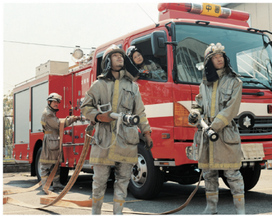
浅田政志〈浅田家〉《消防士》2006 [参考図版]