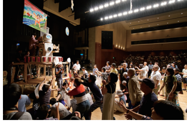
KOSUGE1-16《モリススクランブル》 2018 ©都築憲司 [参考図版]