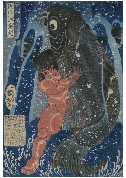
歌川国芳〈坂田怪童丸〉天保7年(1836)頃 八戸クリニック街かどミュージアム蔵 ※浮世絵は展示替えあり